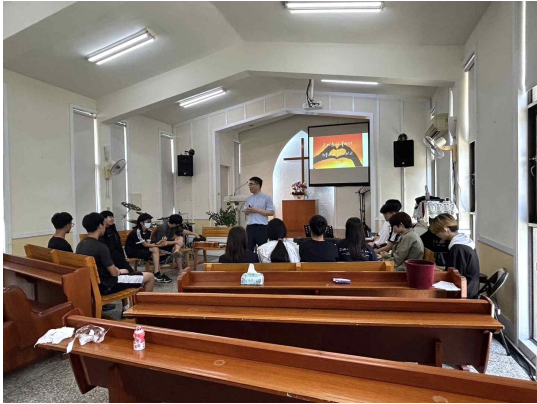
가오슝 한국교회 청소년부 예배모습