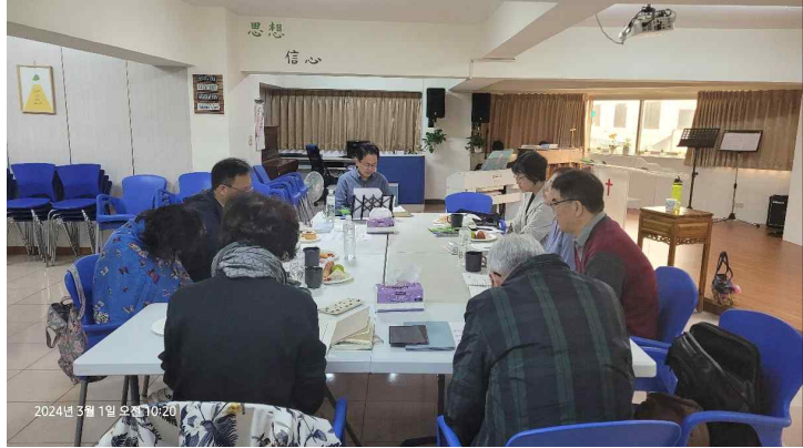
포커싱 가오슝 네트워크 4월 모임